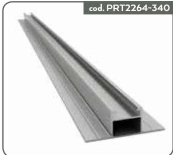
PROFILO TRAVE SOLAR PLUS 340MM