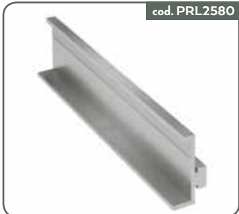
PROFILO TRAVE CONTACT FLAT SLIM 340MM